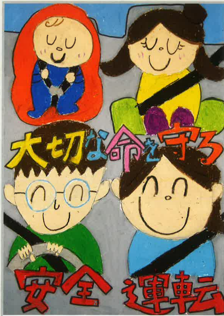
平成30年度JA共済群馬県小・中学生交通安全ポスターコンクール入賞作品 太田市立宝泉東小学校(入賞当時3年生) 栗原ひすいさんの作品